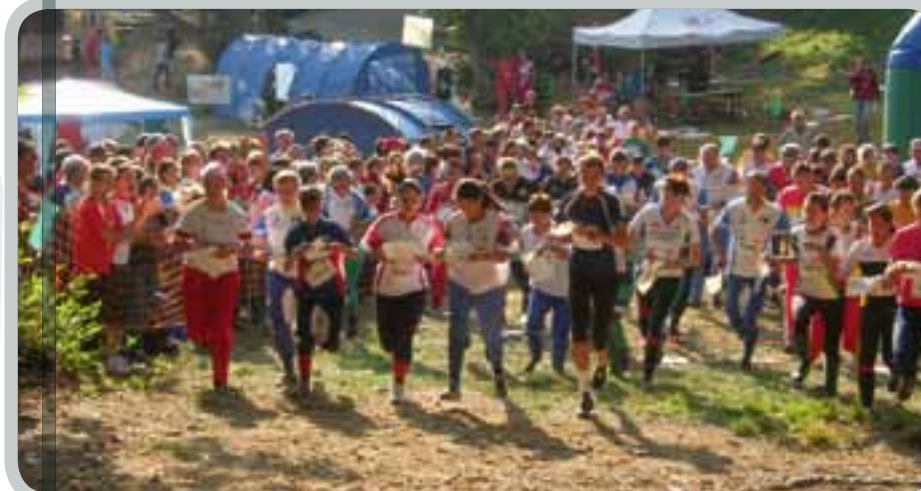
Lancio della staffetta